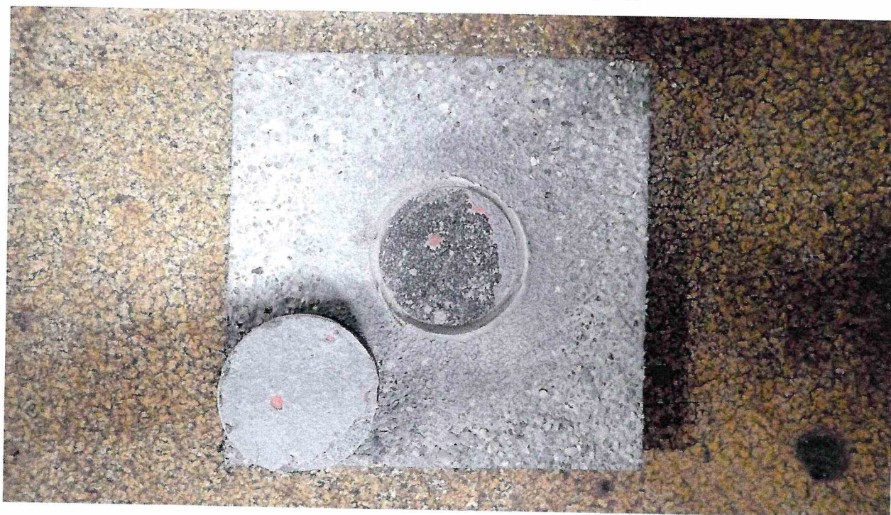
Рисунок 2 – Образец 203/3 МДС № 2, испытанный по ГОСТ Р 59180-2021. Определение прочности сцепления на отрыв при температуре 23 °С