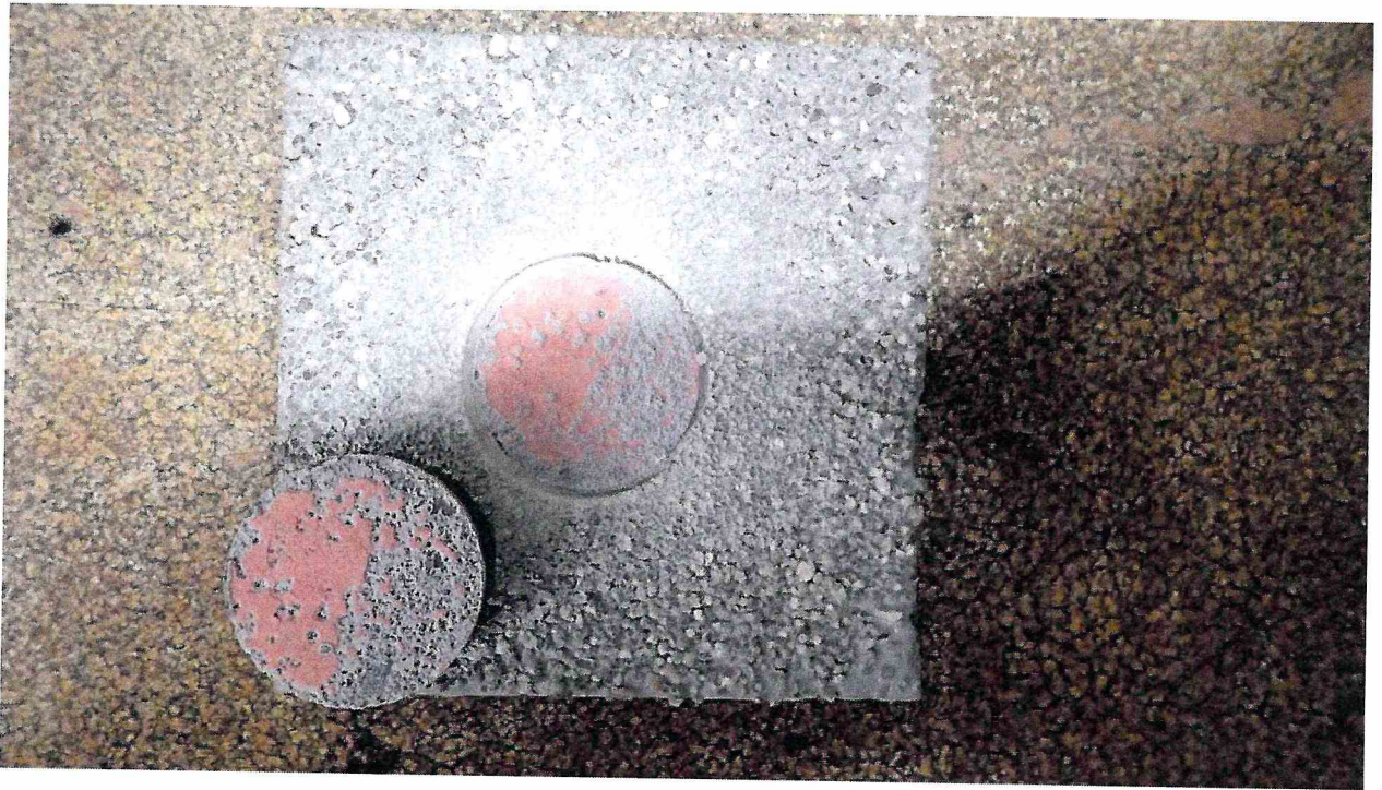
Рисунок 3 – Образец 203/3 МДС № 3, испытанный по ГОСТ Р 59180-2021. Определение прочности сцепления на отрыв при температуре