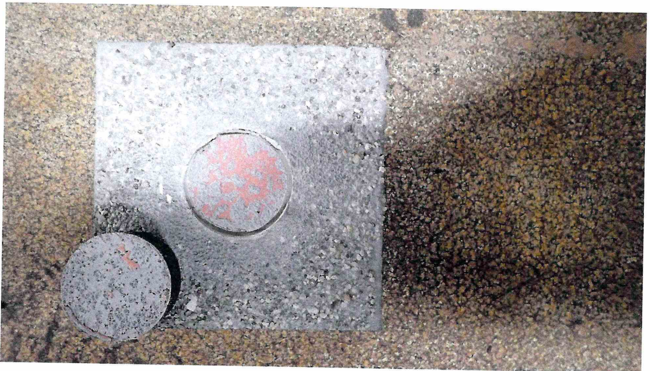
Рисунок 4 – Образец 203/3 МДС № 4, испытанный по ГОСТ Р 59180-2021. Определение прочности сцепления на отрыв при температуре 23 °С