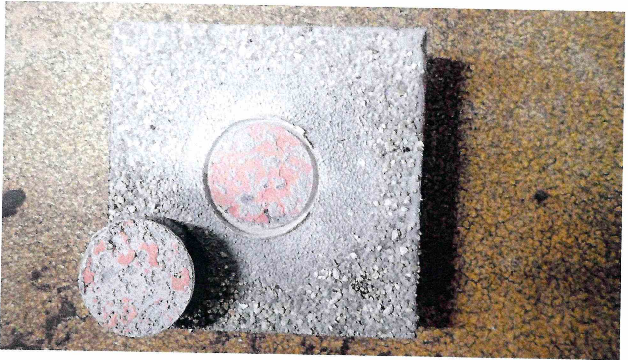
Рисунок 5 – Образец 203/3 МДС № 5, испытанный по ГОСТ Р 59180-2021. Определение прочности сцепления на отрыв при температуре 23 °С