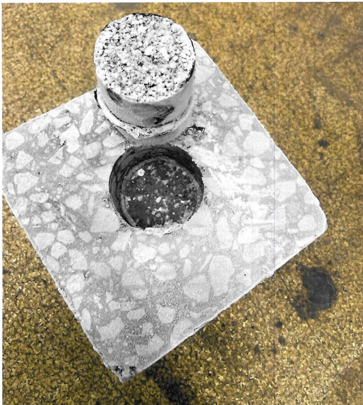
Рисунок 1 – Образец № 1 -40 МДС, испытанный по ГОСТ Р 55402-2013, ГОСТ Р 59180-2021, определение прочности сцепления на отрыв при температуре -40^{\circ}\text{C}

Испытанные образцы по ГОСТ Р 55402-2013, ГОСТ Р 59180-2021, определение прочности сцепления на отрыв при температуре -40^{\circ}\text{C}