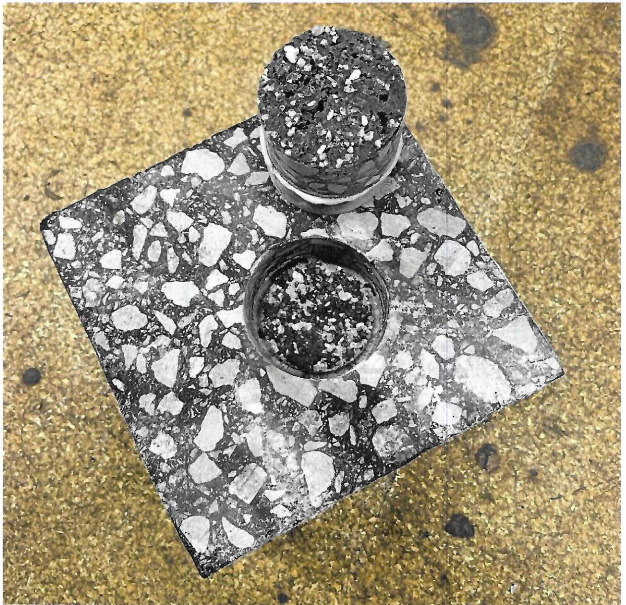
Рисунок 5 – Образец № 5 -40 МДС, испытанный по ГОСТ Р 55402-2013, ГОСТ Р 59180-2021, определение прочности сцепления на отрыв при температуре -40°С