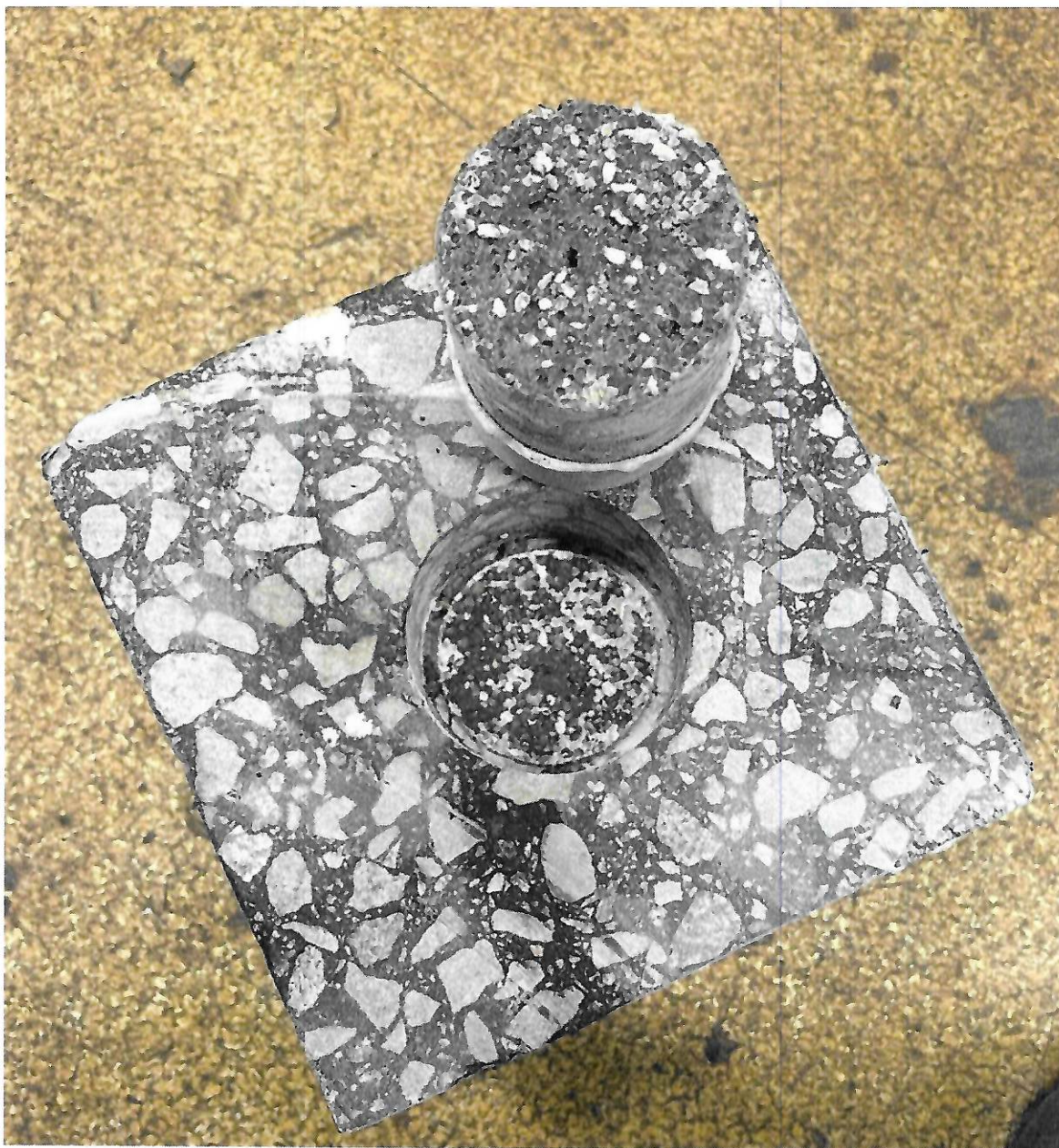
Рисунок 4 – Образец № 4 -40 МДС, испытанный по ГОСТ Р 55402-2013, ГОСТ Р 59180-2021, определение прочности сцепления на отрыв при температуре -40°С